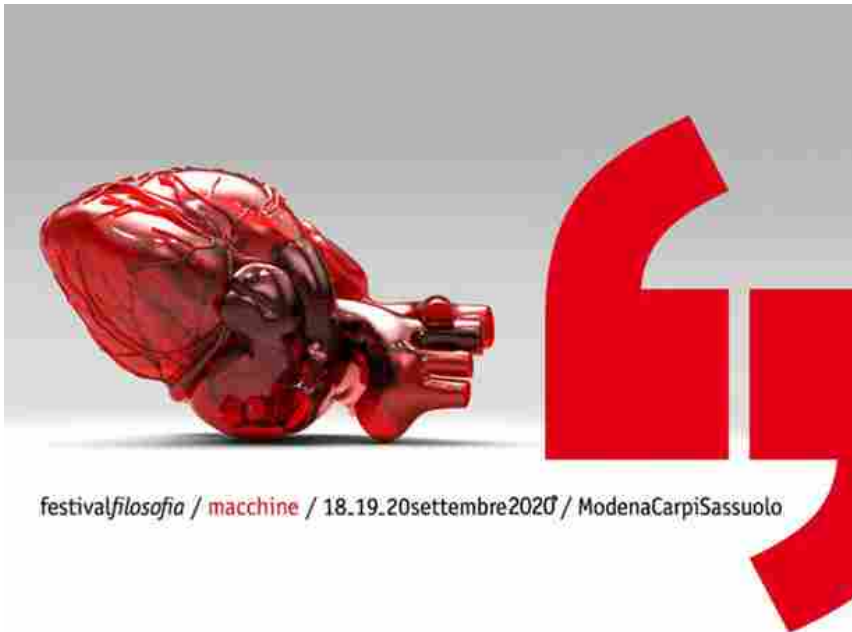
festivalfilosofia / macchine / 18.19.20settembre2020 / ModenaCarpiSassuolo

Dedicato al tema macchine, il festivalfilosofia 2020 è in programma a Modena, Carpi e